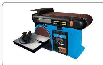
Table en fonte d'aluminium inclinable à 45°